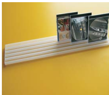
PROVEDENÍ - MATNĚ LAKOVANÝ