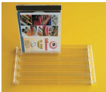
PROVEDENÍ - ČIRÝ + KONCOVKY