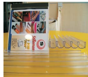
PROVEDENÍ - ČIRÝ